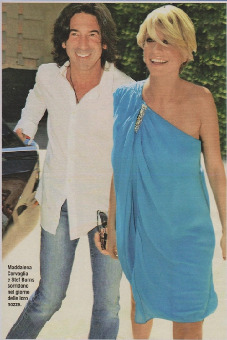
Maddalena Corvaglia e Stef Burns sorridono nel giorno delle loro nozze.