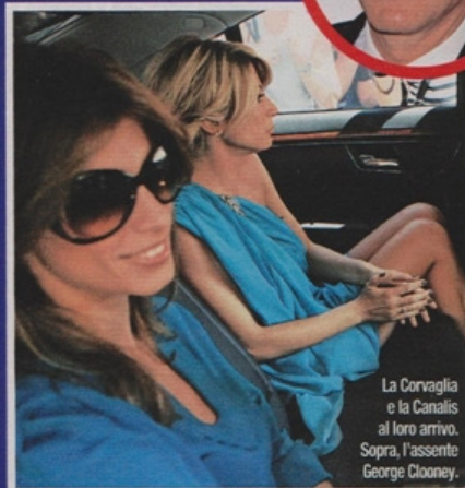
La Corvaglia e la Canalis al loro arrivo. Sopra, l'assente George Clooney.