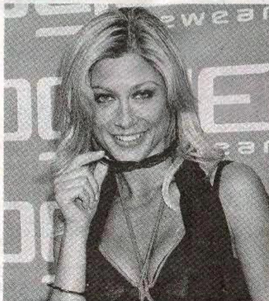
L'ex velina Maddalena Corvaglia

Le prime intenzioni erano di "consumare" il rito delle nozze con lo specialissimo ufficiale di stato civile - il Blasco - nella stessa villa La Personala, all'interno o nel parco esterno a seconda del tempo, che per sabato si annuncia nuvoloso. Occorrerà anche qui una speciale delega,